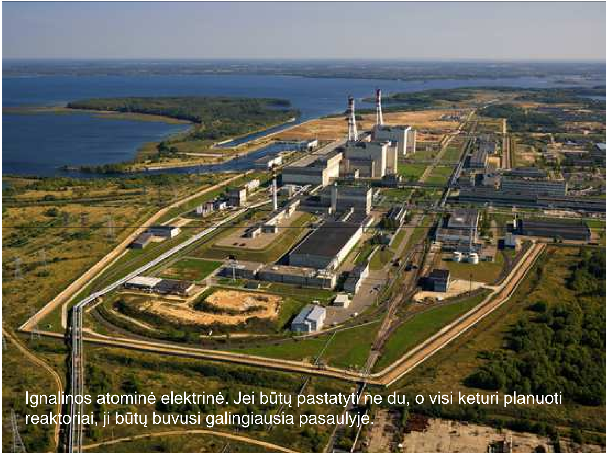
Ignalinos atominė elektrinė. Jei būtų pastatyti ne du, o visi keturi planuoti reaktoriai, ji būtų buvusi galingiausia pasaulyje.