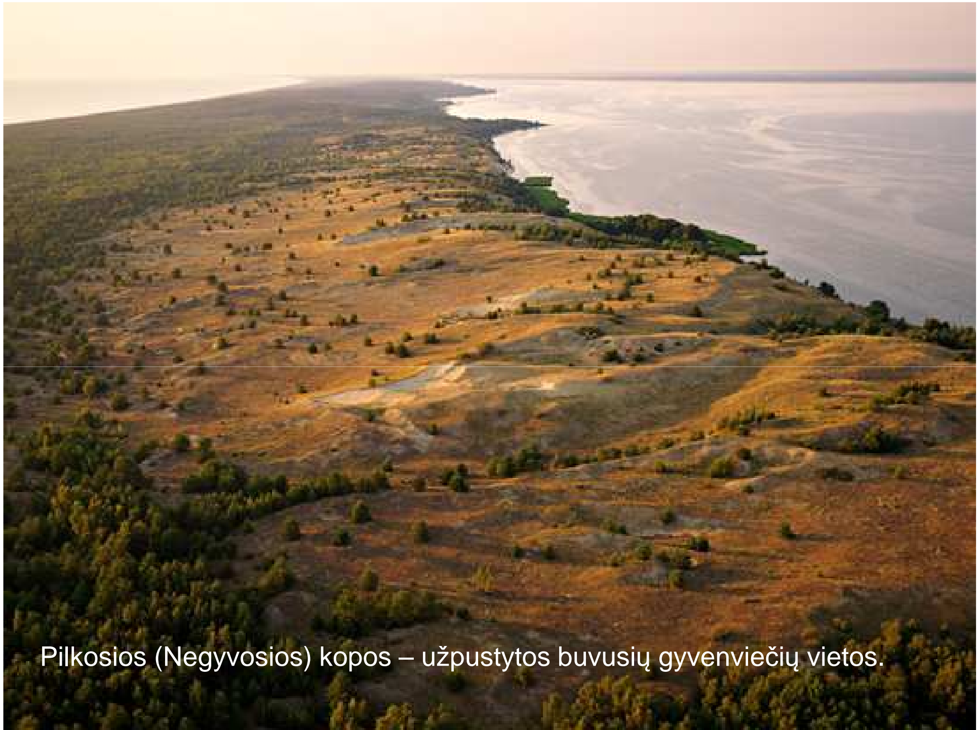
Pilkosios (Negyvosios) kopos – užpustytos buvusių gyvenviečių vietos.