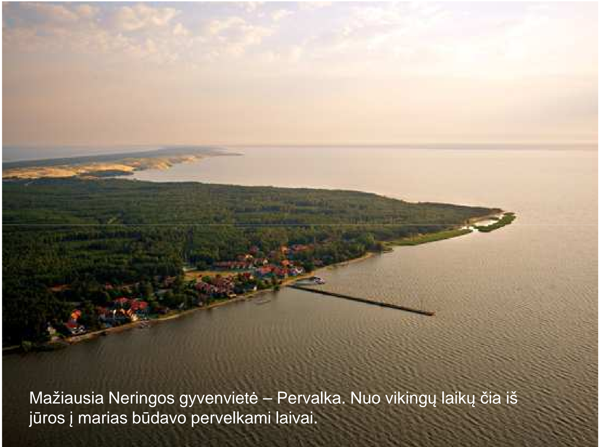
Mažiausia Neringos gyvenvietė – Pervalka. Nuo vikingų laikų čia iš jūros į marias būdavo pervelkami laivai.