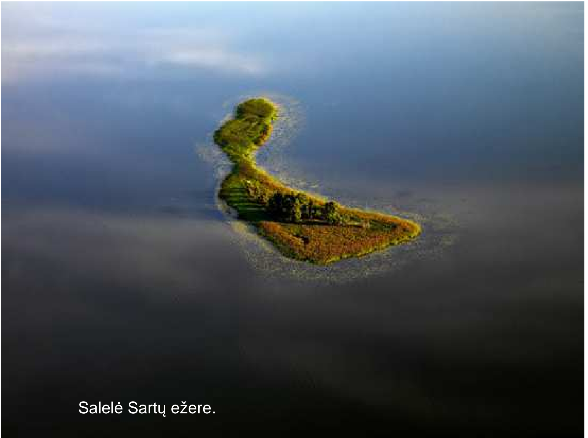
Salelē Sartų ežere.