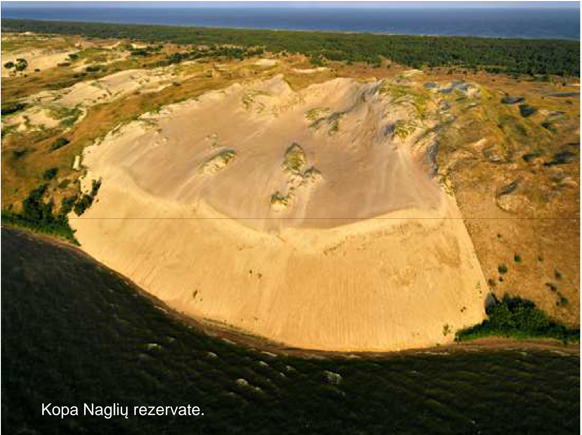
Kopa Naglių rezervate.