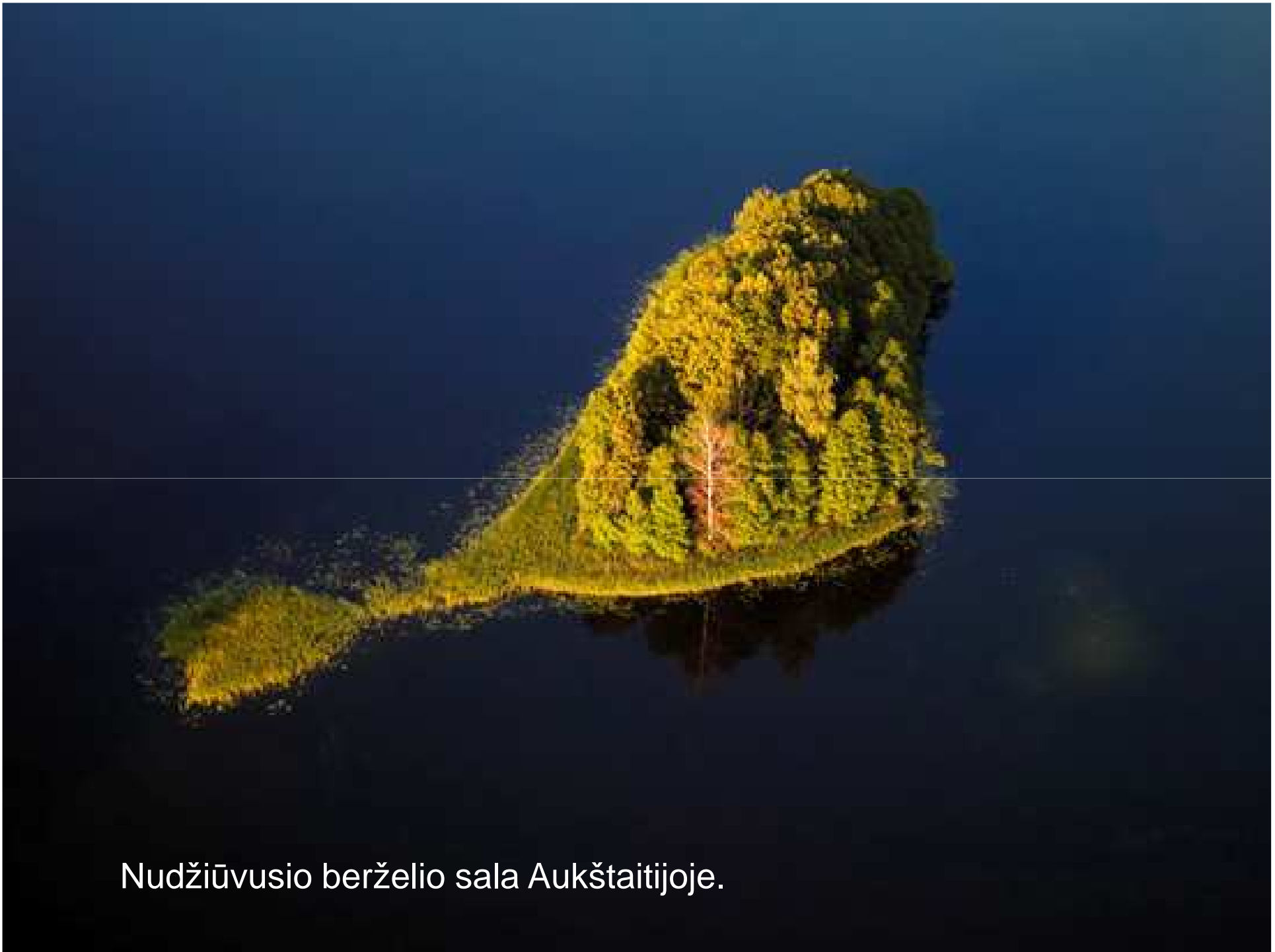
Nudžiūvusio berželio sala Aukštaitijoje.