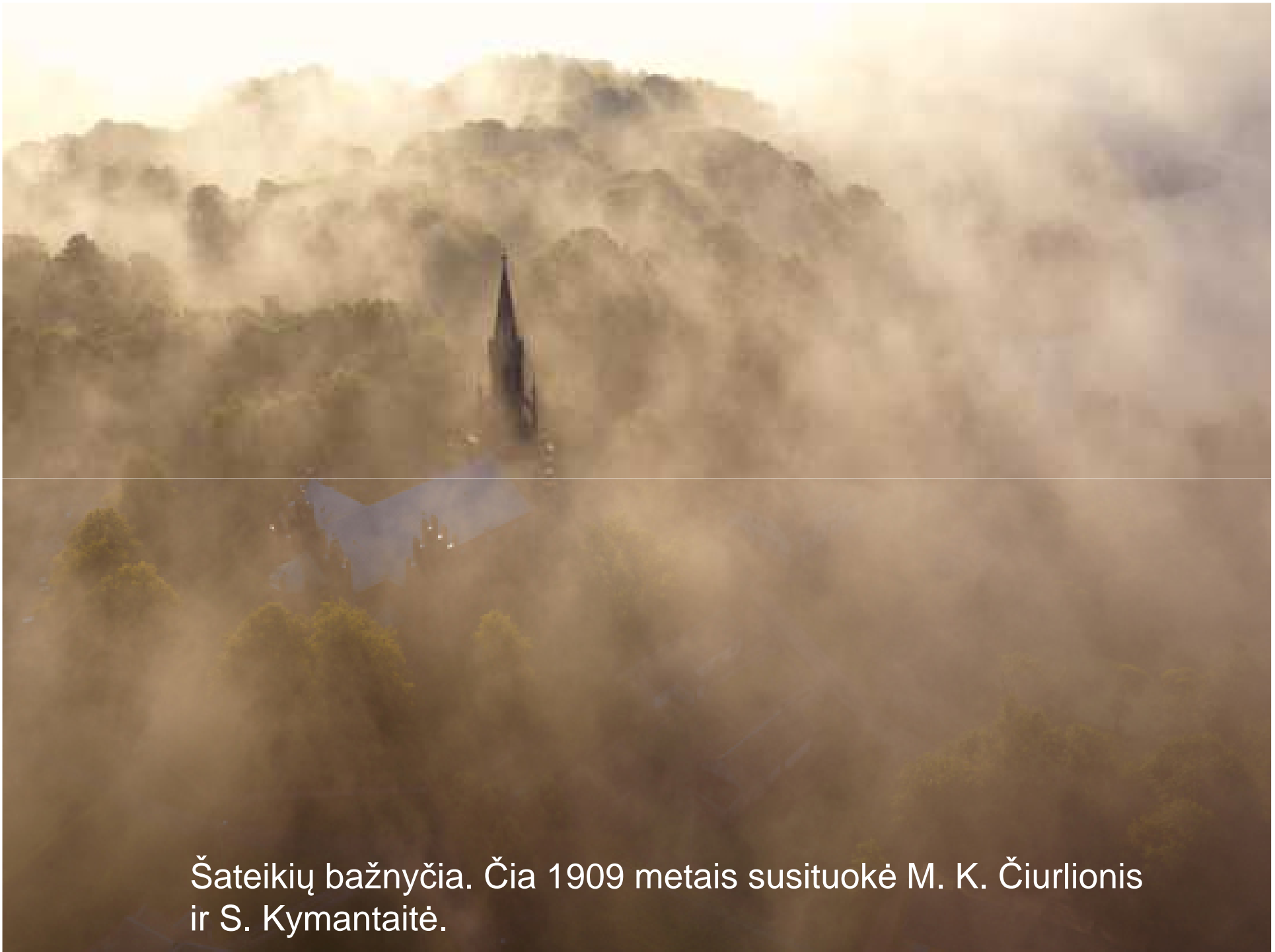
Šateikių bažnyčia. Čia 1909 metais susituokė M. K. Čiurlionis ir S. Kymantaitė.