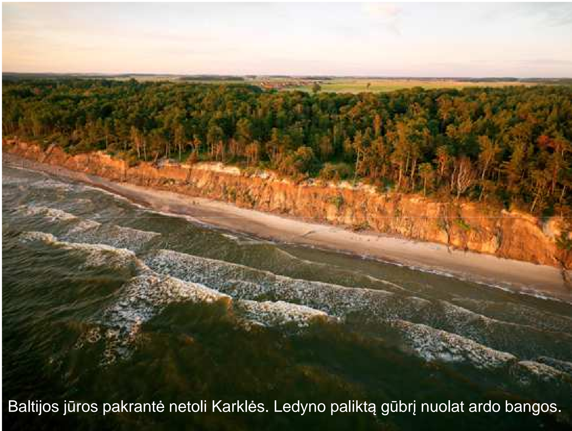
Baltijos jūros pakrantė netoli Karklės. Ledyno paliktą gūbrį nuolat ardo bangos.