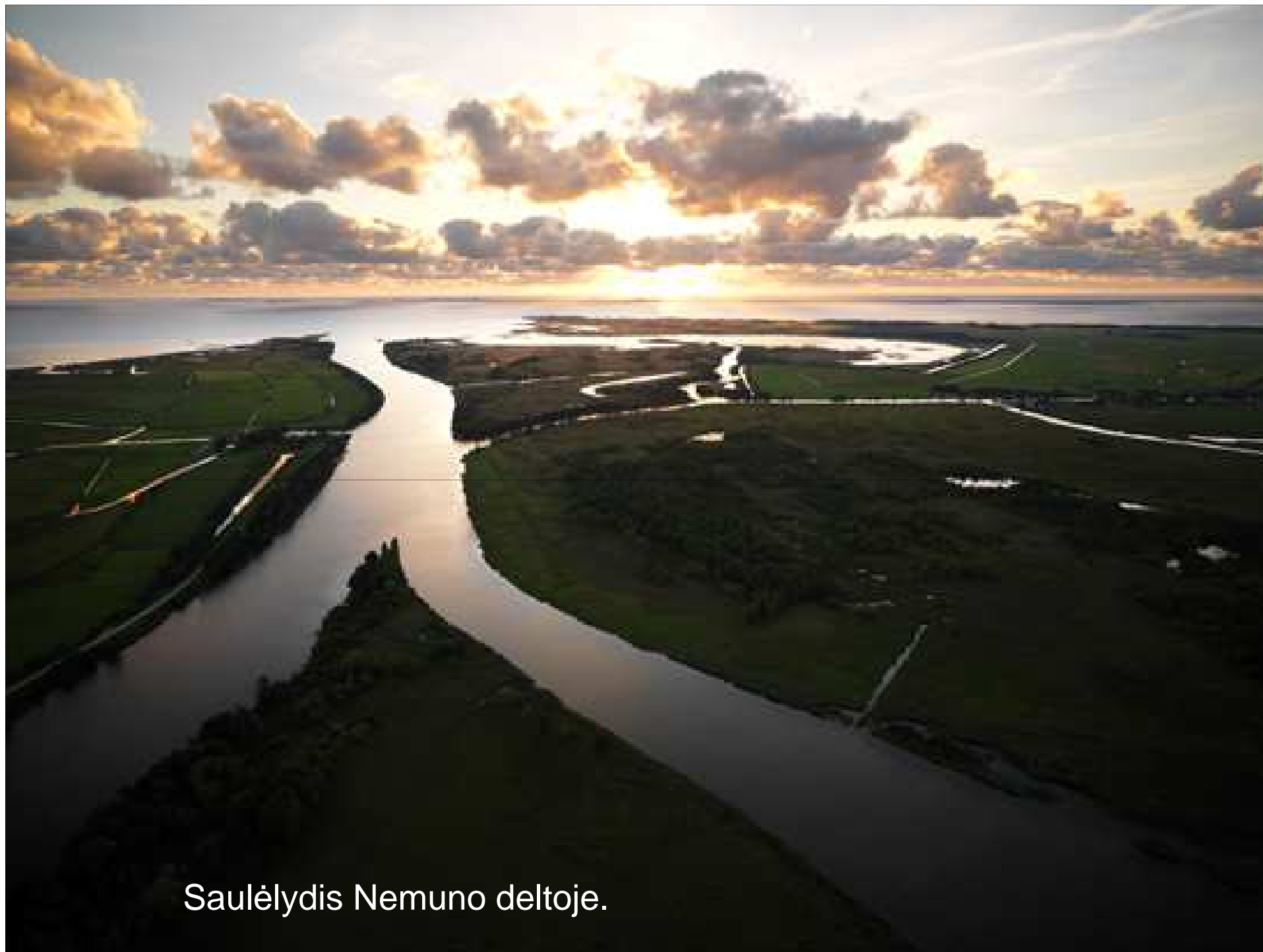
Saulėlydis Nemuno deltoje.