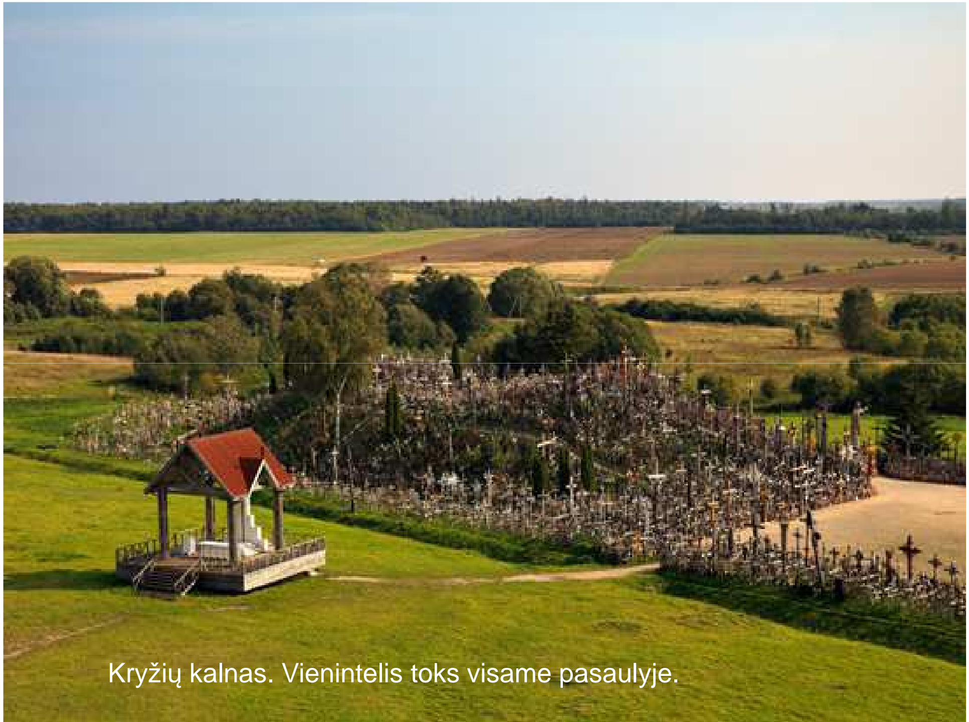
Kryžių kalnas. Vienintelis toks visame pasaulyje.