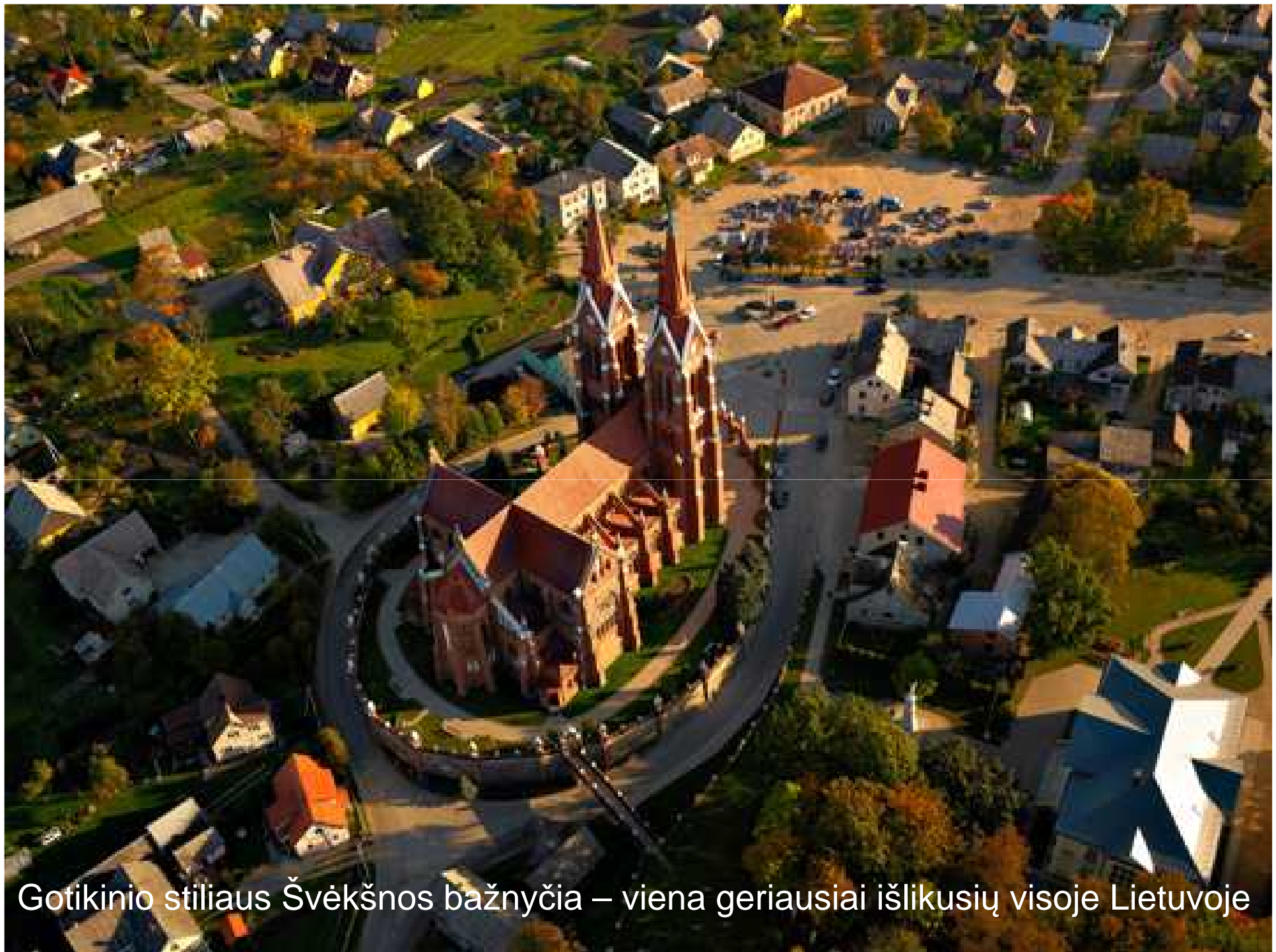
Gotikinio stiliaus Švėkšnos bažnyčia – viena geriausiai išlikusių visoje Lietuvoje