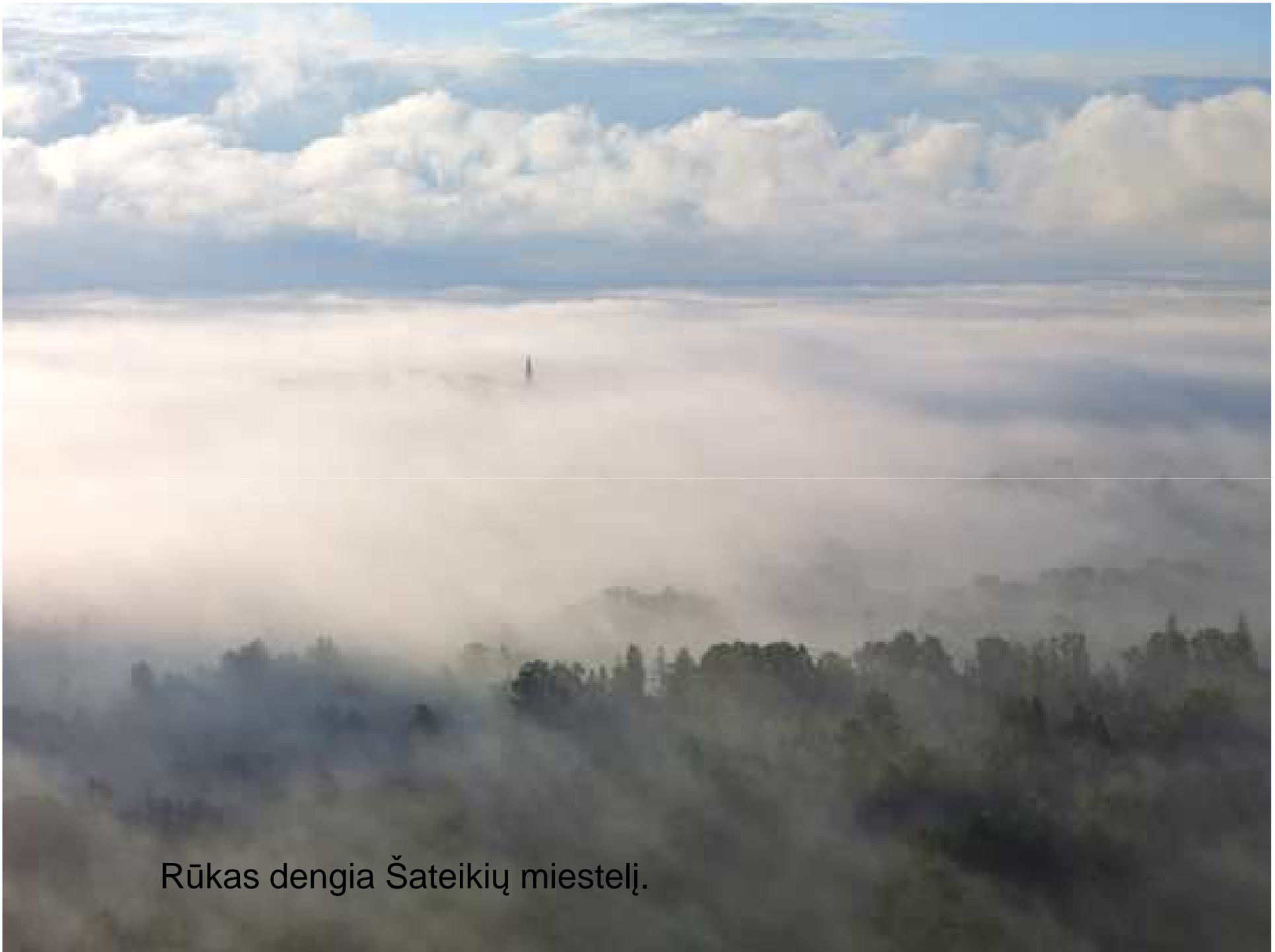
Rūkas dengia Šateikių miestelį.