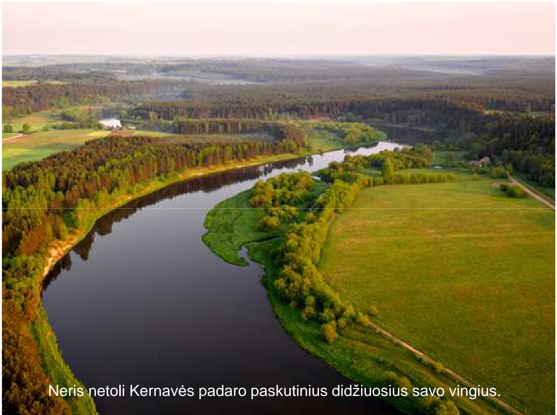
Neris netoli Kernavės padaro paskutinius didžiuosius savo vingius.