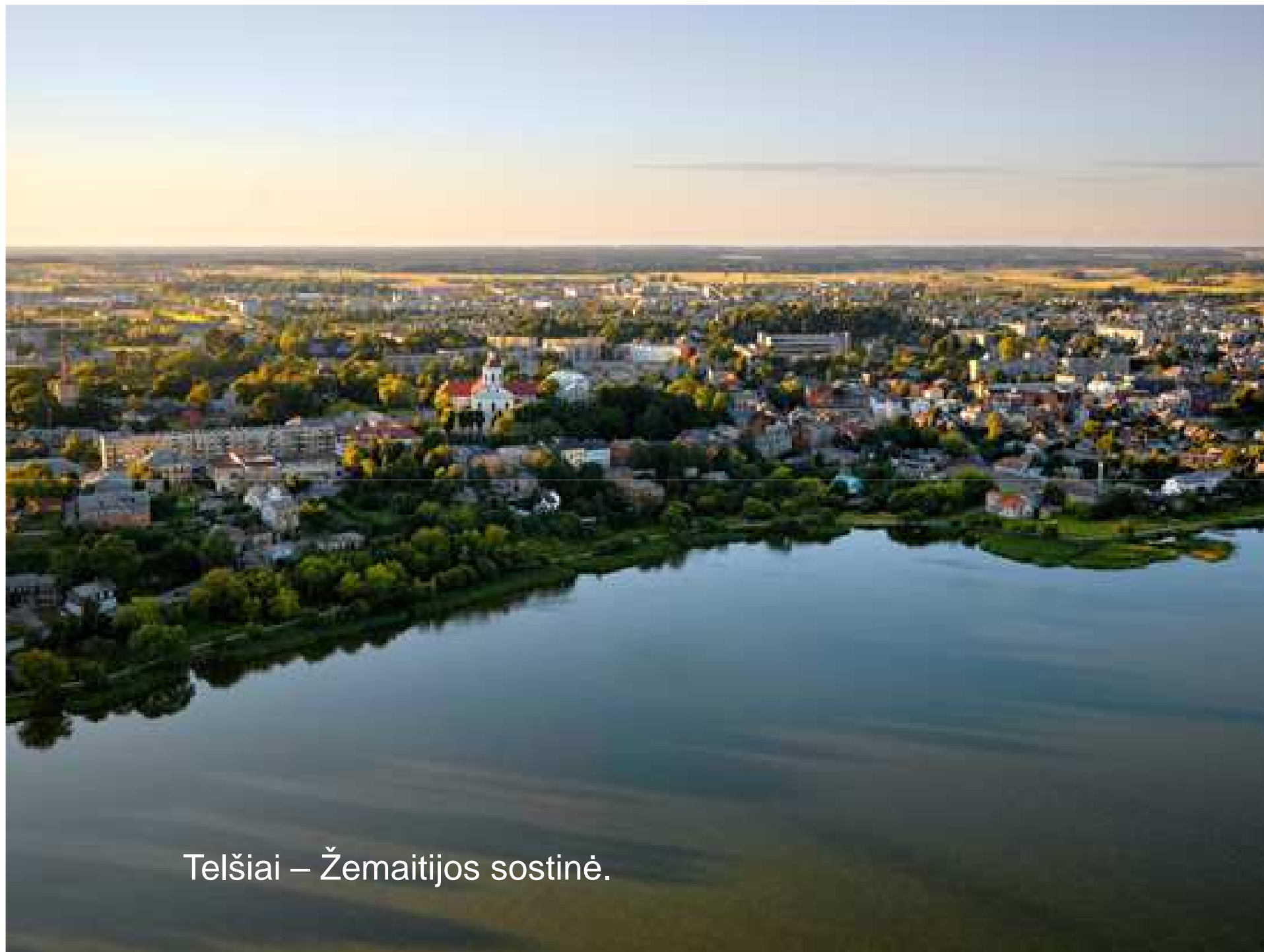
Telšiai – Žemaitijos sostinė.