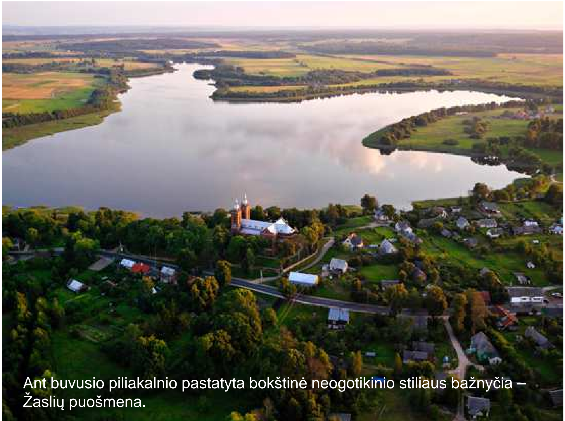
Ant buvusio piliakalnio pastatyta bokštinė neogotikinio stiliaus bažnyčia – Žaslių puošmena.