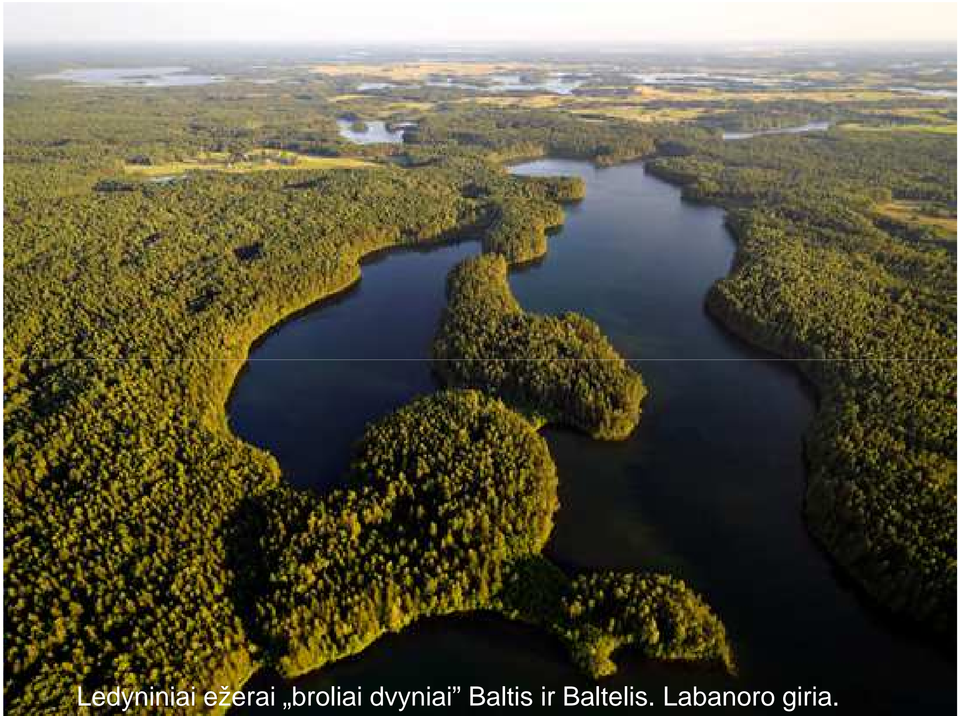
Ledyniniai ežerai „broliai dvyniai“ Baltis ir Baltelis. Labanoro giria.