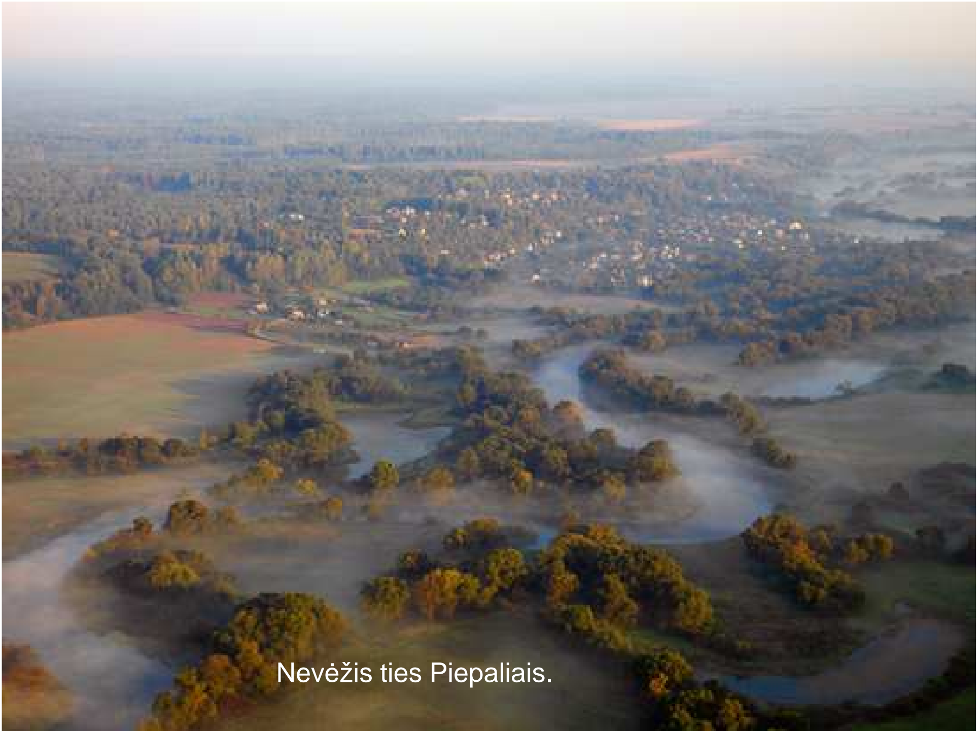
Nevēžis ties Piepaliais.