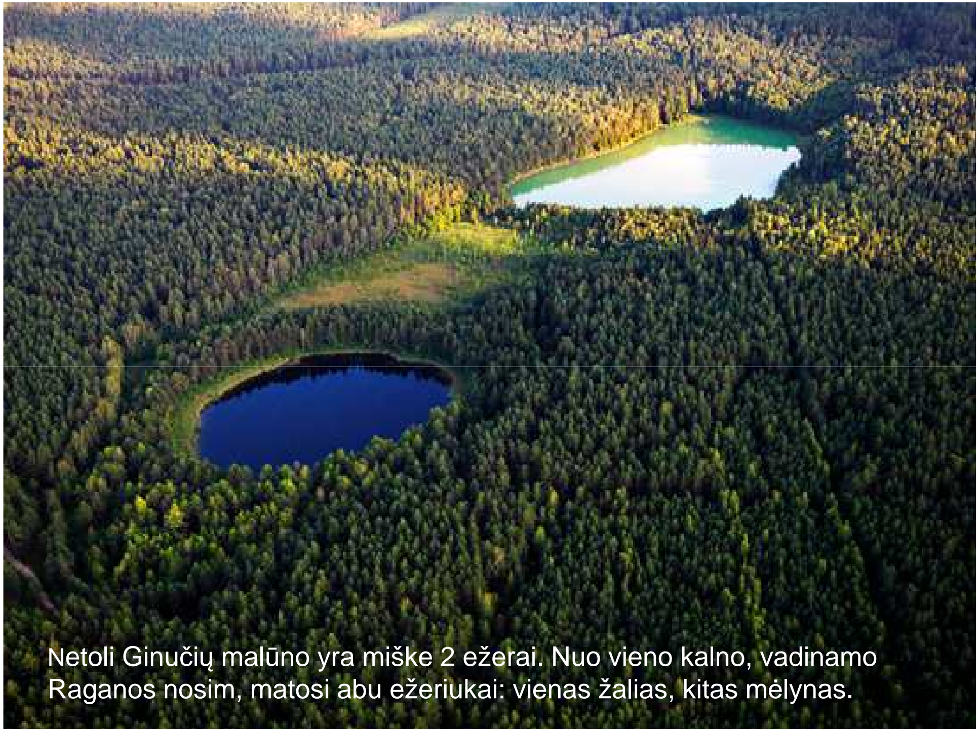
Netoli Ginučių malūno yra miške 2 ežerai. Nuo vieno kalno, vadinamo Raganos nosim, matosi abu ežeriukai: vienas žalias, kitas mėlynas.