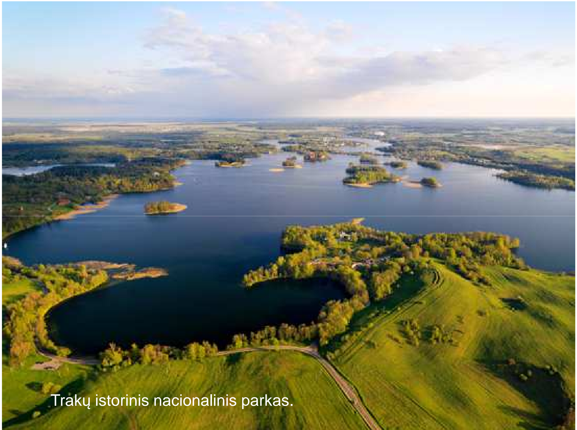
Trakų istorinis nacionalinis parkas.