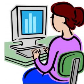
IT specialistas, IT specialistė