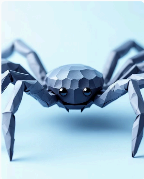
Voras iš burbuliukų

Iš popieriaus burbuliukų su kojomis ir antenomis – sudėtingesnis darbas