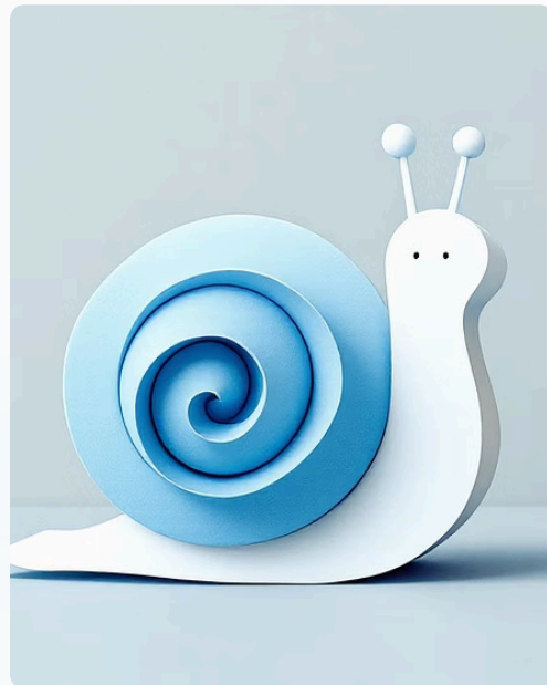
Sraigė iš ritinėlio

Iš popieriaus burbuliukų su kojomis ir antenomis – sudėtingesnis darbas