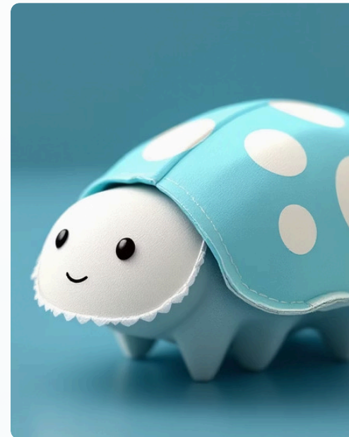
Vabalai iš dėklo

Iš popieriaus ritinėlio su nameliu ir ūsų – detalesnis modelis