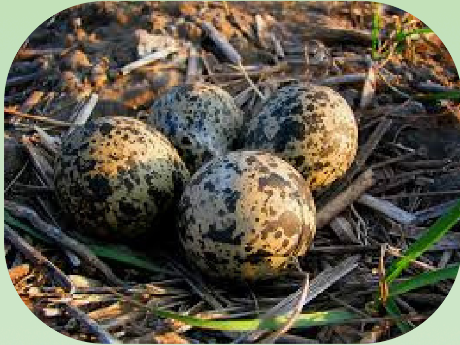
Pempė deda 4 margus, rudai dėmėtus kiaušinius

Klyvis, klyvis, Kas mane padyvys? Kiaušinėlius dėsiu, Vaikelius perėsiu. Kiaušinėliai taškuoti, Vaikeliai kuoduoti.