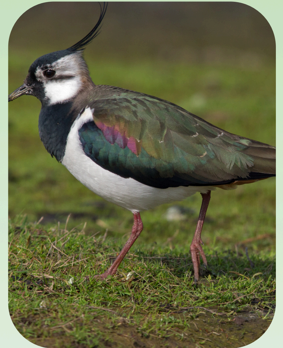
Pempę lengvai atpažįstame iš kuoduko, juodai baltų sparnų bei savito „gyvi... gyvi“ balso

Pempės maitinasi kirmėlėmis, lervomis, vabalais, vorais