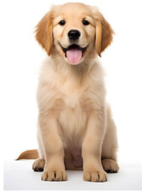
Šuo – au au