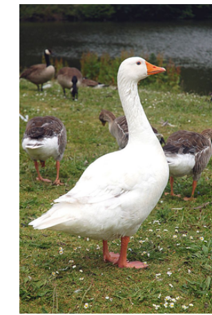
Žąsis – ga ga

Tikslas: Išmokti pagrindinių naminių gyvūnų, paukščių pavadinimus ir jų skleidžiamus garsus.