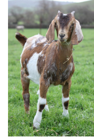
Ožka – bee