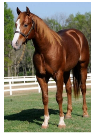
Arklys – iha ha