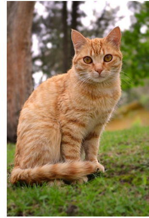
Katė – miau