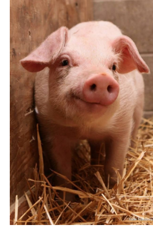
Kiaulė – kriu kriu