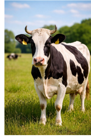
Karvė – mūū