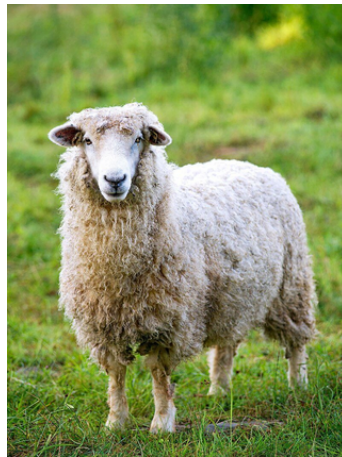
Avis – mee