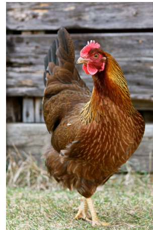
Višta – ko ko