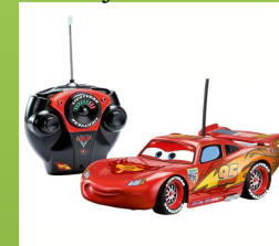
MAŠINĖLĖ – raudona, važiuoja