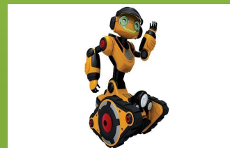
ROBOTAS - vaikšto/juda