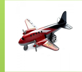
LĖKTUVAS - Skrenda