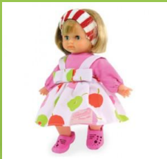
LĖLĖ – žaidžiame, supuojame