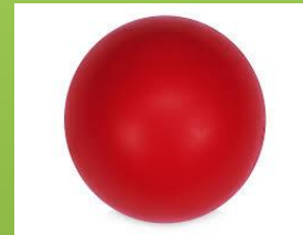
KAMUOLYS – raudonas, rieda, metame