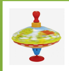
SUKUTIS - Sukasi