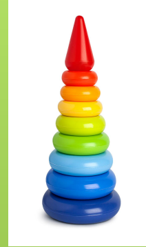
PIRAMIDĖ / statome