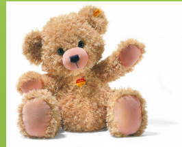
MEŠKIUKAS – rudas, minkštas, apkabiname