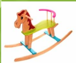
ARKLIUKAS - Joja / juda