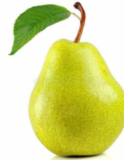
Kriaušė – žalia arba geltona.