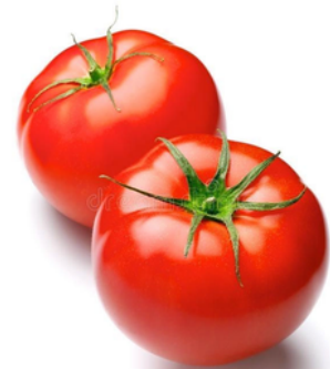
Pomidoras – raudonas, apvalus.