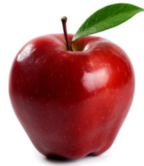
Obuolys – raudonas, saldus.