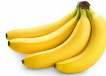
Bananas – geltonas, ilgas.