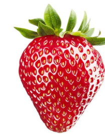
Braškė – yra raudona, saldi ir minkšta