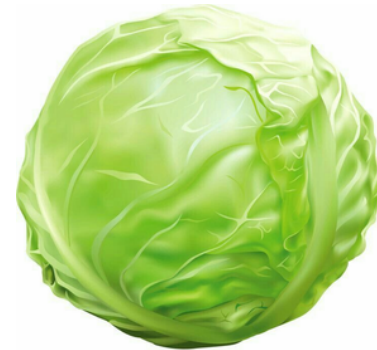
Kopūstas – žalias, apvalus, turintis daug lapų.