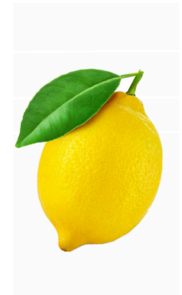
Citrina – geltonas ir labai rūgštus vaisius.

Tikslas: Išmokti pagrindinių vaisių, daržovių pavadinimus ir jų savybes (spalvą, skonį).