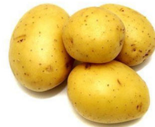
Bulvė – ruda, auganti žemėje.