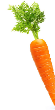
Morka – oranžinė, kieta.