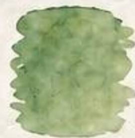
Žalia (medis, lapai)