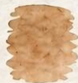
Ruda (medžio kamienas)